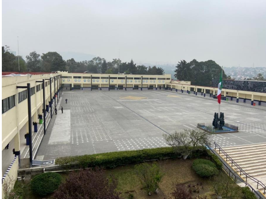
Levantamiento Técnico en los Edificios de la Universidad de la Policía (SSC)

De una universo de más de 3 mil inmuebles se han seleccionado los que cumplen las siguientes condiciones